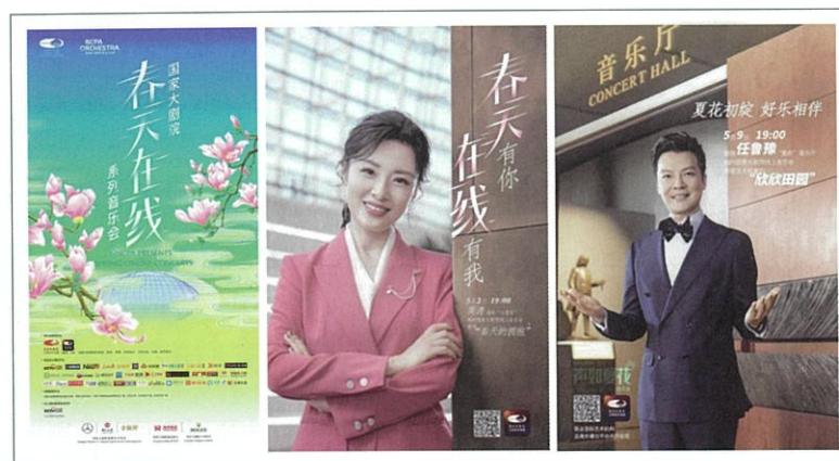
图3 国家大剧院线上音乐会海报