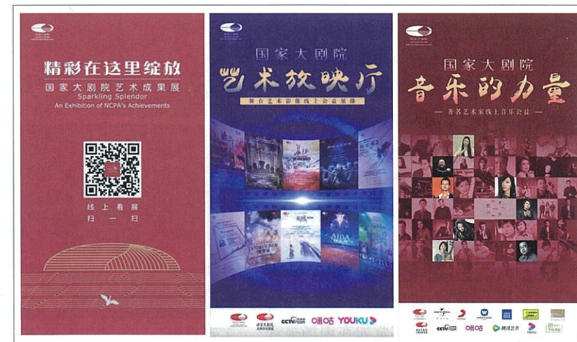
图1 国家大剧院线上展厅、线上放映厅、艺术家线上音乐公益平台