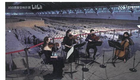
图5 秦始皇陵博物馆举办的音乐会

线下去剧场观看舞台演出，除了保持仪式感，还要遵守相关的观演礼仪。而线上观看时，观众可能是坐在家中舒适的沙发上，可能躺在床上，也可能是在地铁和公交上。观看空间的不同，使得线上