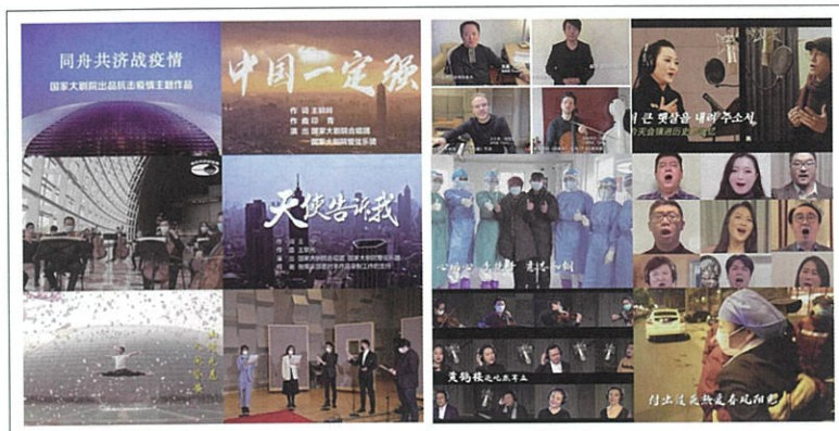
图2 国家大剧院部分抗击疫情主题作品

为了让全网观众达到高清晰度的观看体验，直播设备特别升级为4K超高清摄像机，同时使用了在剧场内很难有空间应用的大型摇臂和轨道机器人摄像机等特种设备（见图4）。在音频的录制上除了声音采集使用了空间传声器、点传声器外，还使用了人工头传声器，通过录音师的精细调整保证了直播声音的表现力。为了更好地改善线上收听古典音乐的声效，在央视网的播放器中还新增了双耳虚拟环绕声技术。制作中充分考虑移动用户的观看场景，使观众能够清晰地感觉如在现场被音乐的包围感，声像环绕双耳的运动感，为